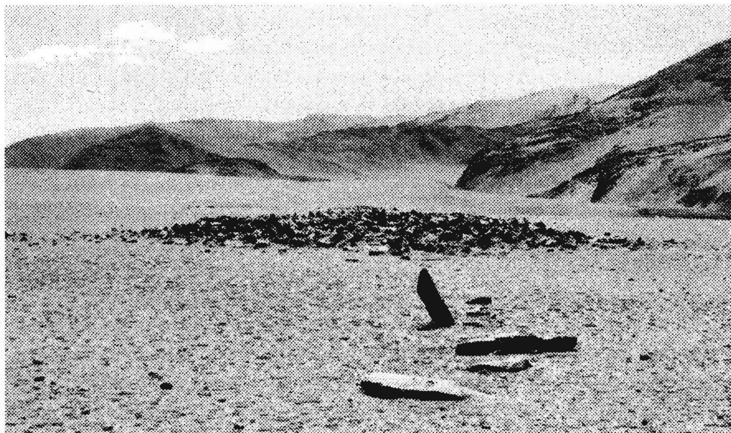
Рис. 2. Могильник Улан-Хусы-Хундийн.