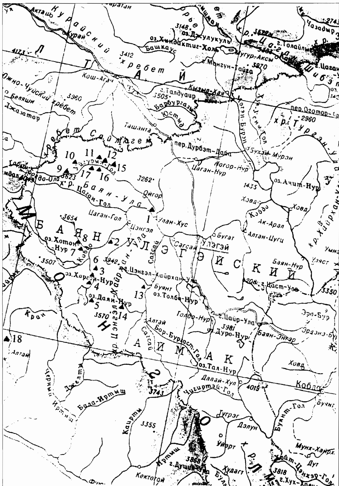
Рис. 1. Пазырыкские могильники в Баян-Улэгэйском аймаке Монголии.

насыпи к кольцу. Крутые курганы, окруженные квадратными оградами с дополнительными небольшими круглыми насыпями, размещенными по четырем углам ограды, по нашему мнению, к херексурам не относятся. Мы предлагаем называть их «четырёхкупольными» курганами. Предпринятые