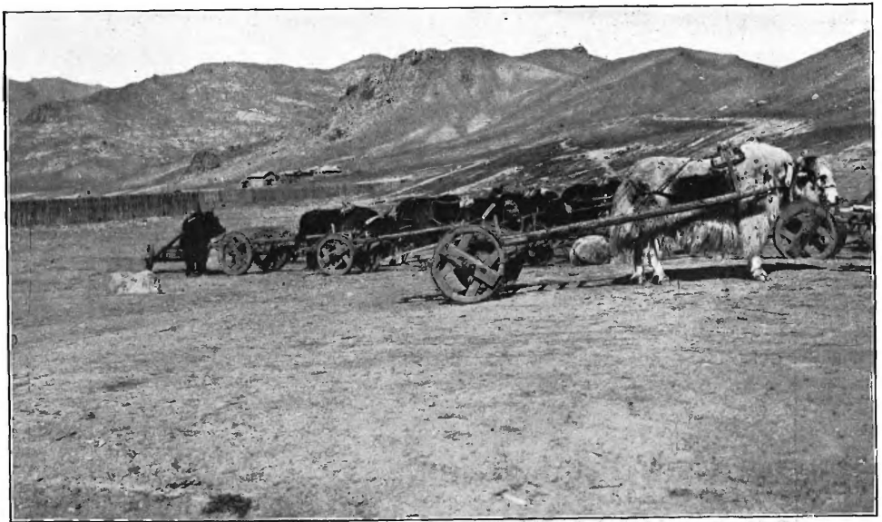
Яки въ запряжкѣ въ г. Улясутаѣ.