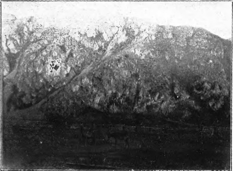
Маралы въ маральникѣ.