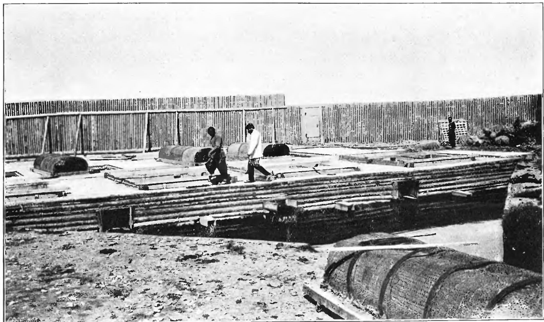
Мойка Коковина въ Ургѣ.