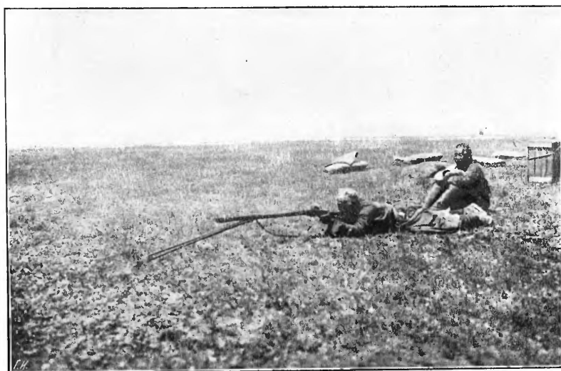
Монгольскіе охотники на сурка.