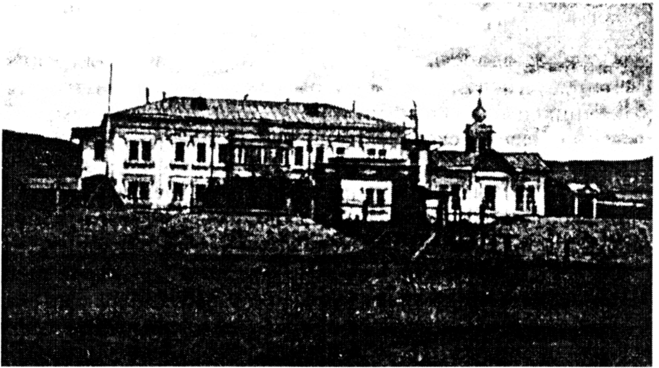
Русское консульство в г.Урге. нач XX в.