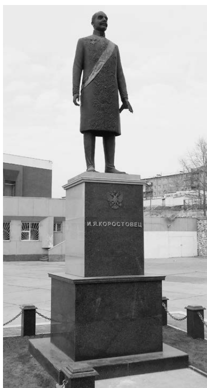
Памятник И.Я. Коростовцу в Улан-Баторе. Установлен в 2014 г.

Признанию Внешней Монголии государством не препятствовало то, что ее территория называлась в договорах частью терри-